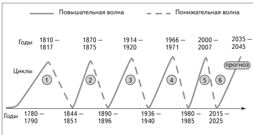
Рис. 1. Циклы Кондратьева

Некоторые авторы считают, что существует феномен ускорения (сжатия) длинных волн. Если первый цикл длился 55–60 лет, то второй — уже 45–48 лет. Вполне вероятно, что современные циклы укладываются в 40-летний и даже меньший срок, учитывая нарастание темпов НТП.